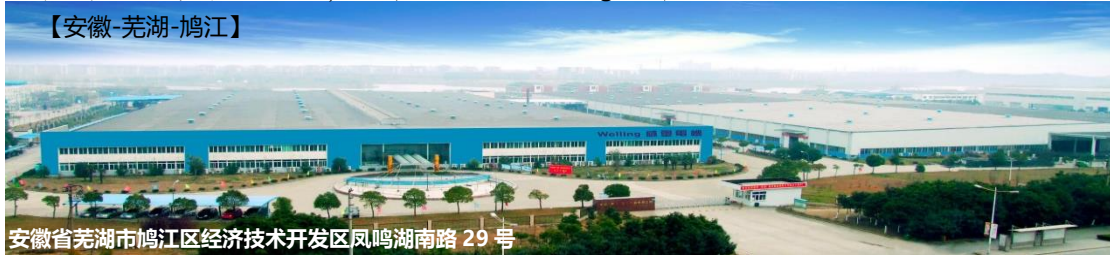
安徽省芜湖市鸠江区经济技术开发区凤鸣湖南路29号